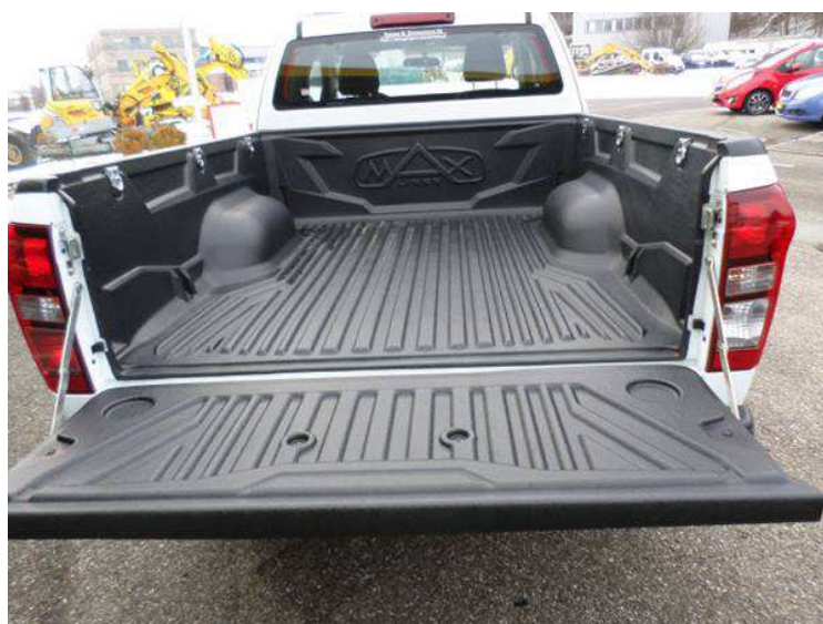
Vue du pont de chargement (environ 1.1 m 3 / 880 kg)