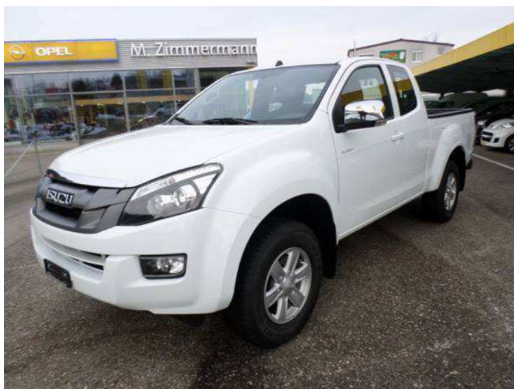
Le Isuzu Dmax Crew Planet (vue de la calandre et de la cabine)

Enfin, ce véhicule est le seul dont la charge utile avec attelage soit de 3'500 kg, soit 700 kg de plus que son concurrent direct chez Toyota.