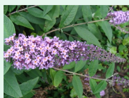
Buddleia de David