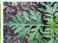
Ambrosie à feuilles d'armoise