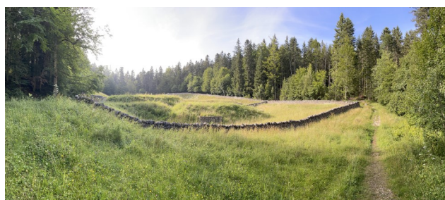
Ruines d'Oujon août 2021

N° 170 – SEPTEMBRE 2021 Édité par la Municipalité