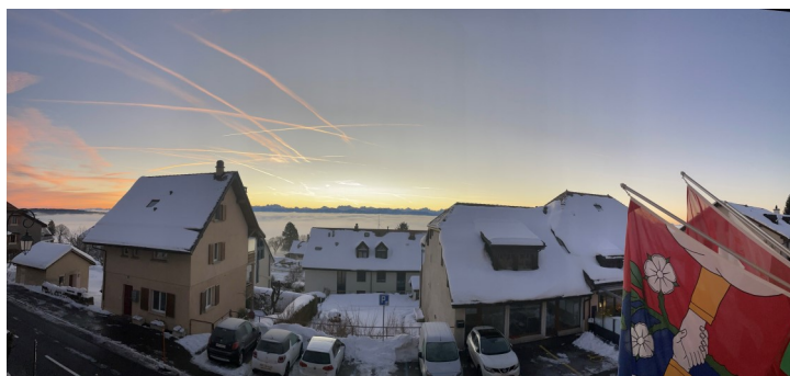
Administration communale - décembre 2021