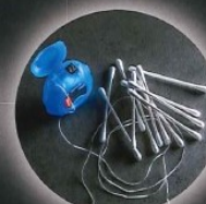
Fil dentaire, coton-tiges