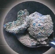
Litière pour chat