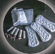
Tampons et serviettes hygiéniques