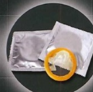
Préservatifs et autres ...

Les déchets à ne jamais jeter dans les toilettes: les lingettes, les tampons et protections périodiques, les cotons-tiges, les cartons de rouleau de papier de toilette, les lames de rasoir, les médicaments, les préservatifs, les lentilles de contact, la peinture et les produits toxiques, les huiles et graisses alimentaires, la litière pour chat.