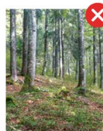
Boisement forestier (intérieur du peuplement)