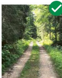
Chemin forestier fondé