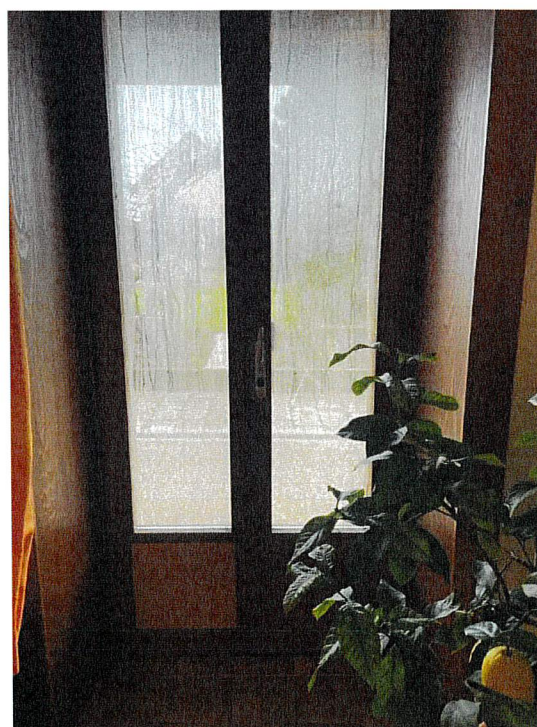
Condensation sur les fenêtre

L'analyse a clairement déterminé deux causes à cette problématique :