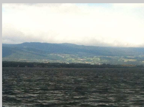
Vue d'Arzier-Le Muids