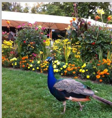
Un paon curieux lors du café-croissant

Le 10 septembre dernier, 60 personnes ont participé à la traditionnelle sortie organisée par la Municipalité. Cette année, cap sur Genève, avec un arrêt café-croissant au Jardin Botanique. Puis, visite de l'ONU. Le repas de « midi » a été pris au Château de Penthes à Pregny-Chambésy. Pour la digestion, la croisière de la Sirène nous a fait découvrir les plus belles bâtisses du bord du Lac Léman. Petit arrêt sur une terrasse et retour sans bouchons dans nos foyers ! Merci pour votre participation, vos sourires et votre bonne humeur... A l'année prochaine !